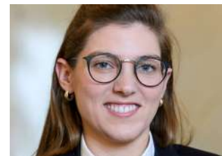
Franziska Ryser Nationalrätin GRÜNE SG

Tax» ein neues Steuerschlupfloch vor, mit dem Rohstofffirmen ihre Gewinne künftig noch privilegierter besteuern könnten. Wir GRÜNE werden uns in der Frühlingssession und darüber hinaus dafür einsetzen, dass der Rohstoffsektor mit Transparenz und fairen Steuern seinen Beitrag leistet – auch in Zeiten von Krieg und Krisen.